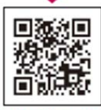
会員登録はこちら

※電子マネーWAONカード・WAON POINTカードの会員登録は、右の二次元コードを読み取り、専用サイトへアクセス、または https://www.smartwaon.com へアクセス